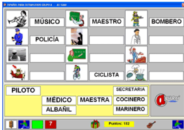
Figura 2 Campo semántico: profesiones