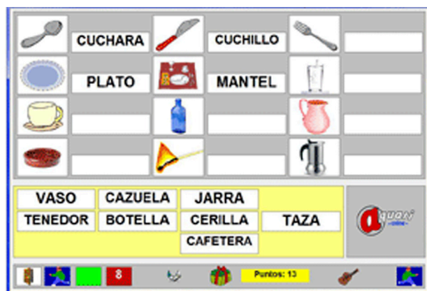
Figura 1 Campo semántico: cocina